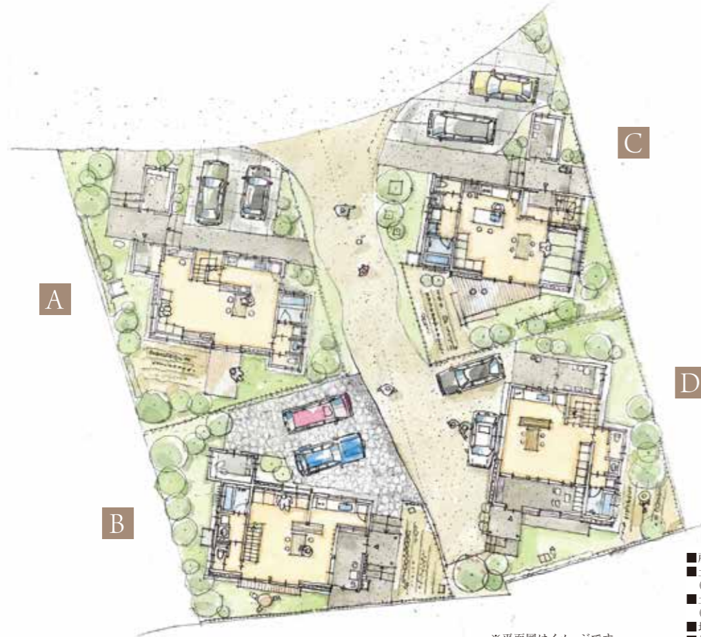
※平面図はイメージです。