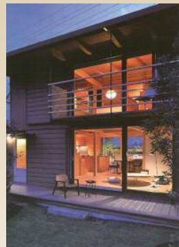
大開口木製サッシ 「アイランドプロファイル」

今回は(有)扇建築工房様のご協力で実際の家づくりの現場を3回に分けて公開していきます。 建ててからでは見られない長生き住宅の秘密を現場で見学しながら詳しく解説します。 また、最終回はランドスケープを含めた住まいをご覧頂きながら 設計者からその想いや設計作法について語ってもらいます。