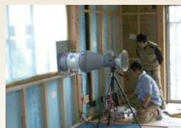
新サービスの気密測定