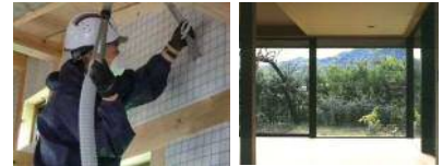
断熱吹き込み作業

内容：高性能木造サッシと樹脂窓、デコス 協力企業：デコス/アイランドプロファイル/YKKAP